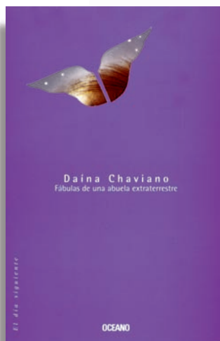
Después de 14 años de publicada, Editorial Océano, de México, relanza Fábulas de una abuela extraterrestre .

de Novela; Casa de juegos , Planeta, 1999, y Gata encerrada , Planeta, 2001). Conoció la obra de Daína hace veinte años , cuando siendo una adolescente publicó su primer libro de relatos, Los mundos que amo (1980), que se convirtió en un best-seller , algo increíble dentro del atrofiado mecanismo editorial cubano. En aquel entonces, empezaba sus estudios de Lengua y Literatura Inglesas,